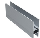
BİRLEŞİM PROFİLİ JOINT PROFILE