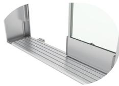
EŞİKSİZ RAY WITHOUT THRESHOLD LOCK