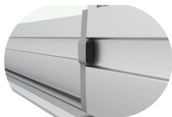
AKILLI KAPAK ERASEABLE PANEL