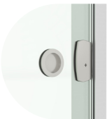
ÇİFT YÖNLÜ KİLİT DOUBLE WAY LOCK

Aksesuar Rengi Accessory Color Siyah / Black Gri / Grey